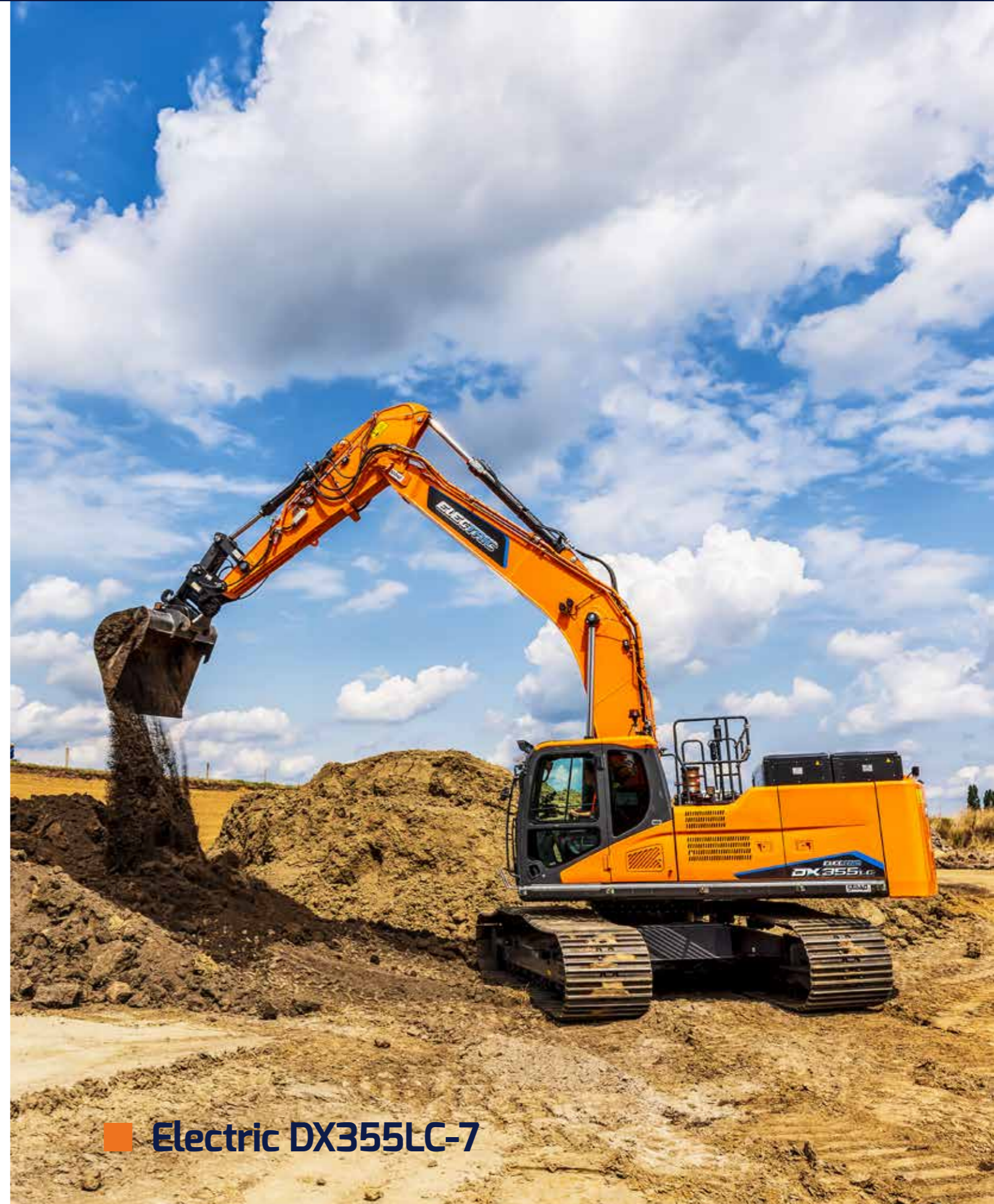
■ Electric DX355LC-7