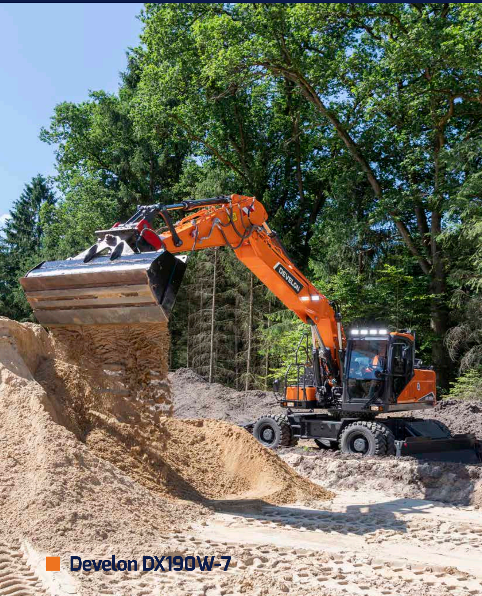
■ Develon DX190W-7