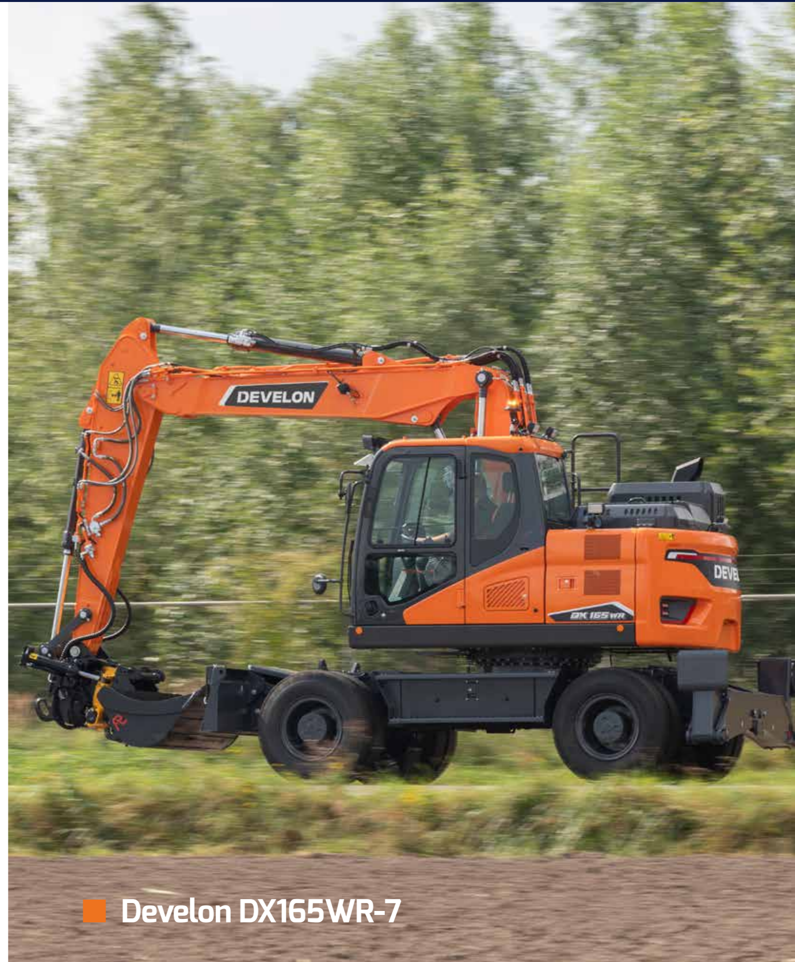
■ Develon DX165WR-7

Omdat Staad constant in beweging is, breiden en vergroten we ons verhuurassortiment continu uit. Hierdoor werken we altijd met het beste materieel en sluit het assortiment perfect aan op de behoefte van jou als klant.