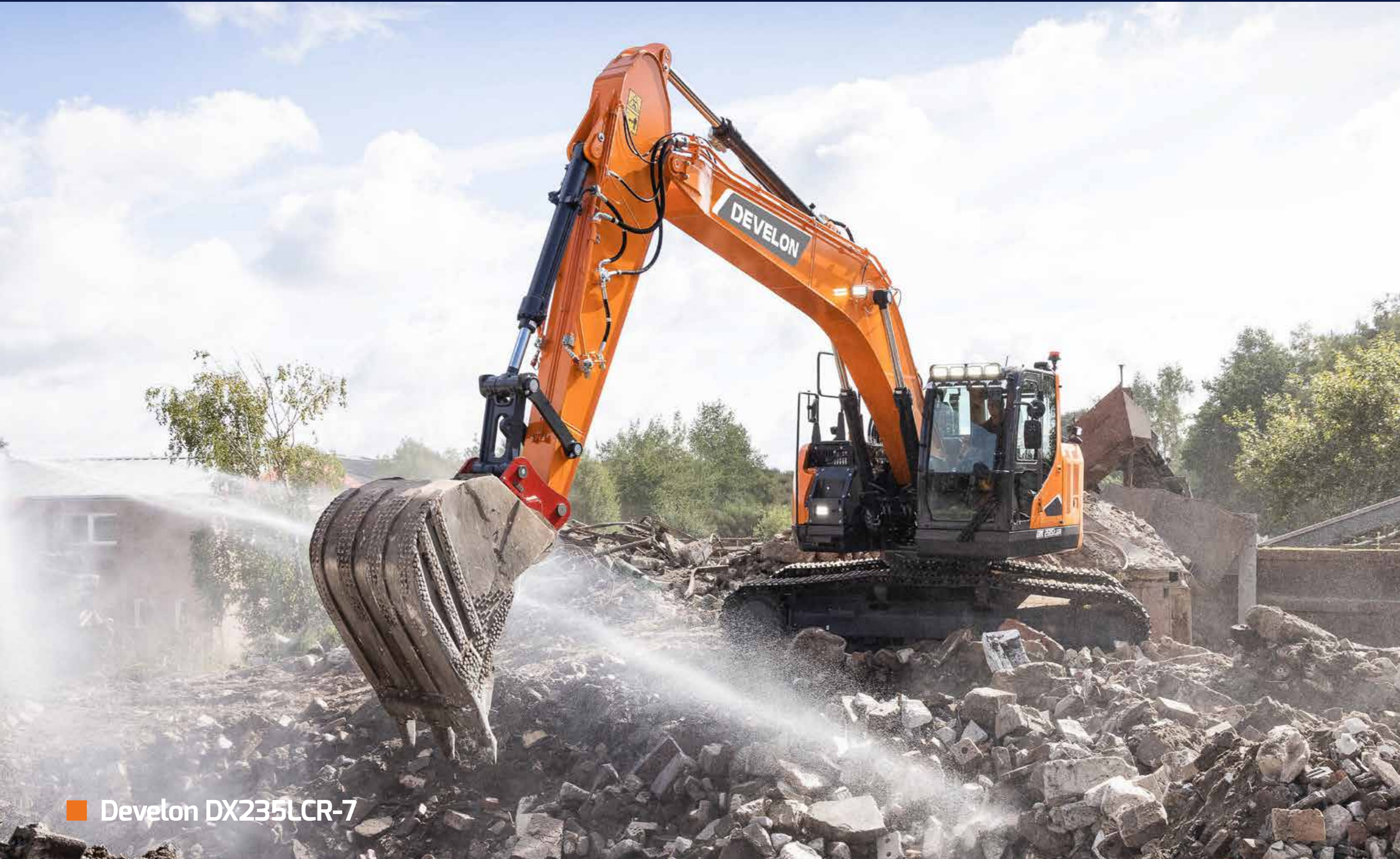
■ Develon DX235LCR-7