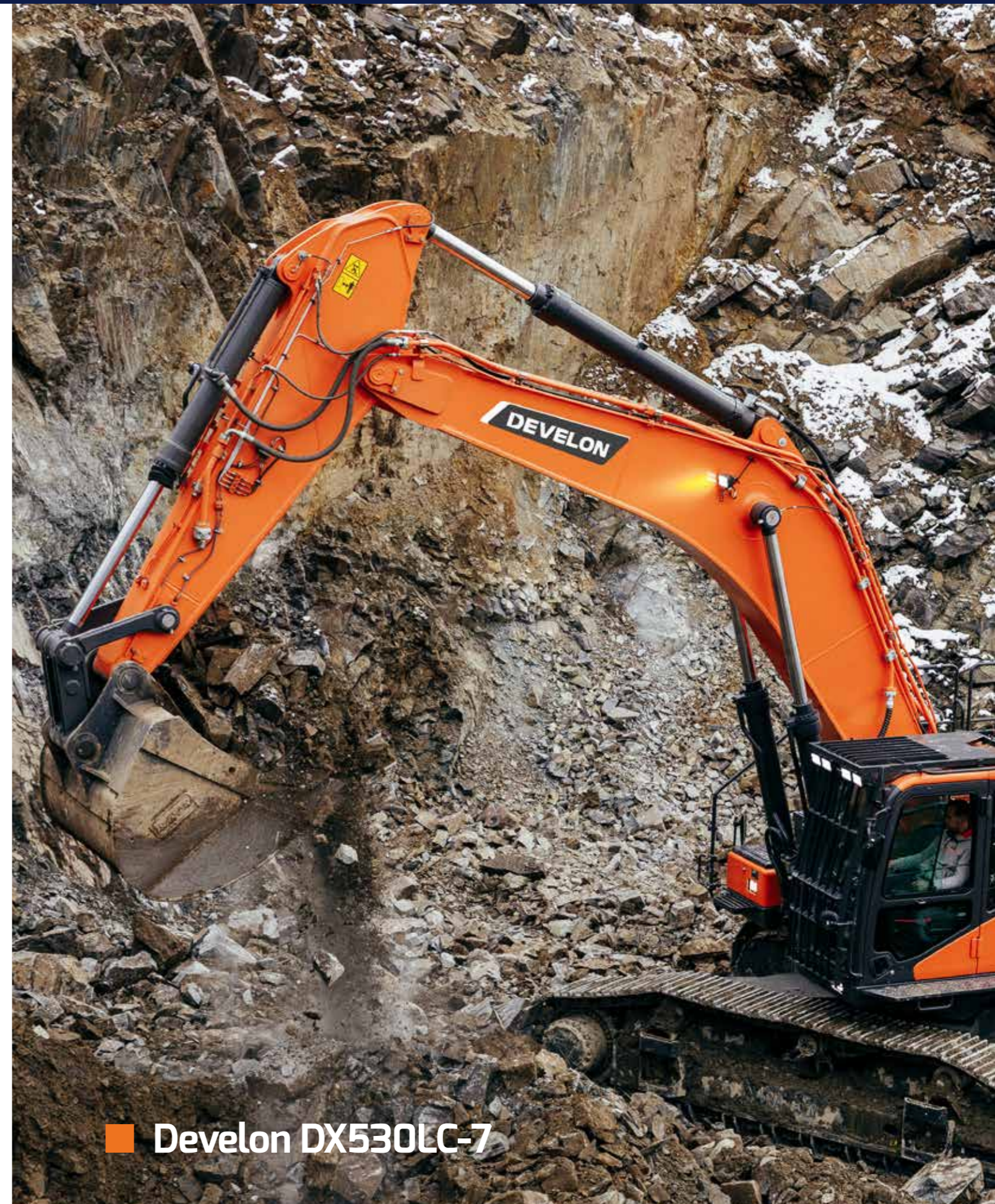
■ Develon DX530LC-7

*Getoonde afbeelding kan afwijken van het model dat geleverd wordt