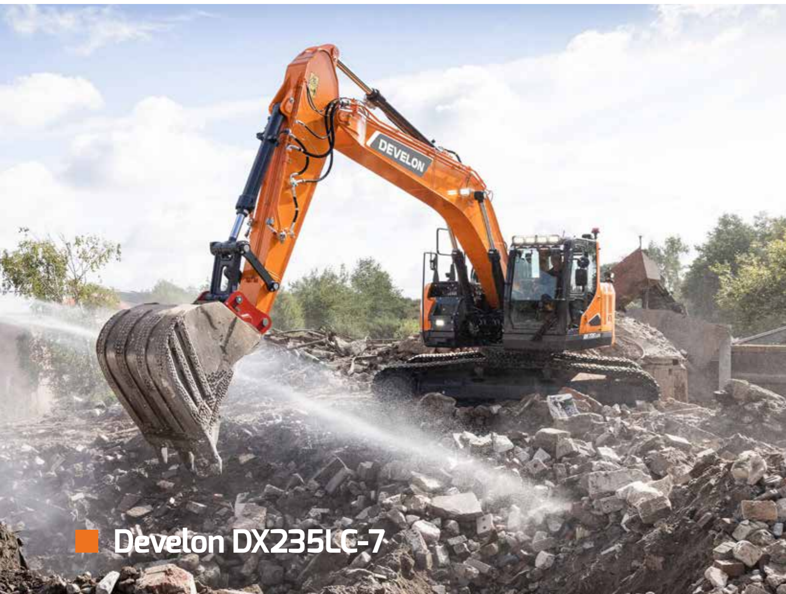
■ Develon DX235LC-7