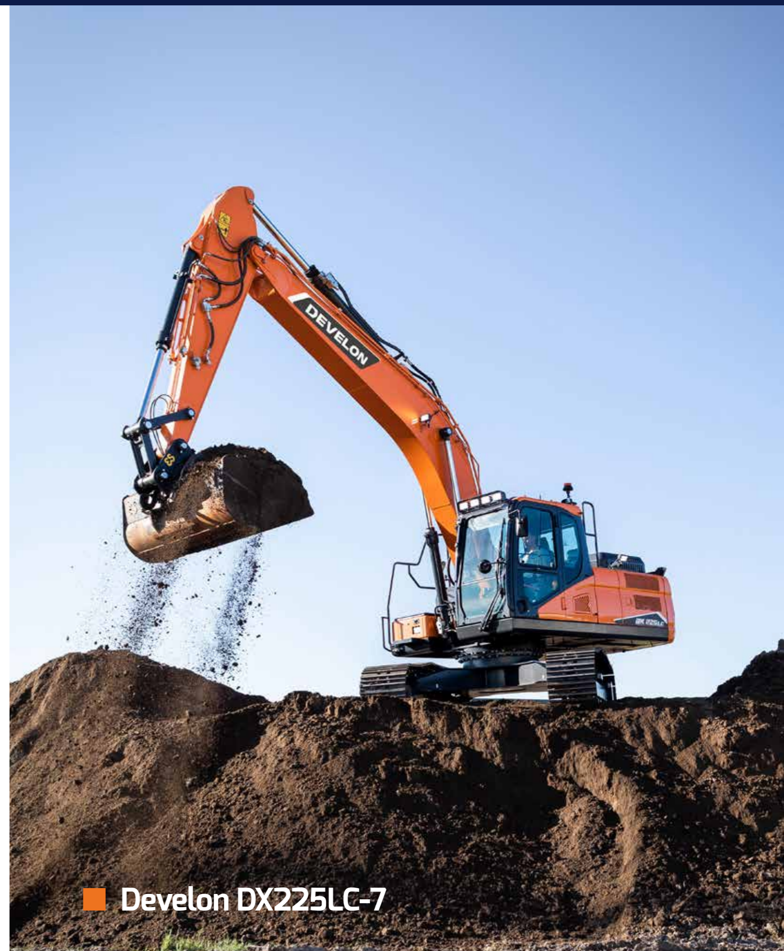
■ Develon DX225LC-7